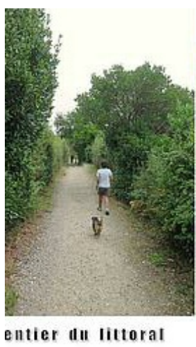
entier du littoral