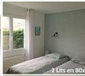
2 Lits en 80x