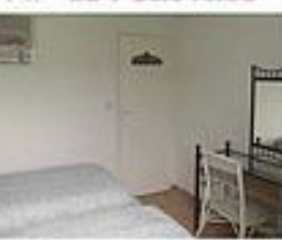
CH 1 ' Le Petit Nice '