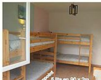
5 lits en 90 x 2m 1 lit junior 70 x 140