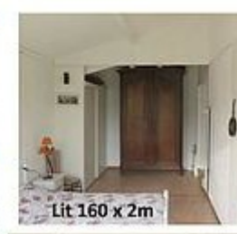
Lit 160 x 2m