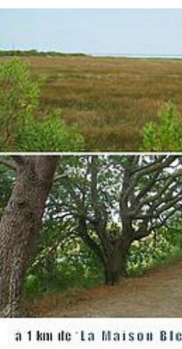
a 1 km de 'La Maison Ble