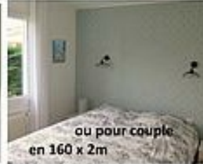
ou pour couple en 160 x 2m