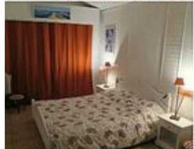
CH 3 ' Le Banc d'Arguin '