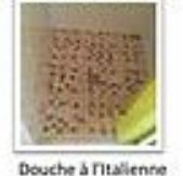
Douche à l'italienne