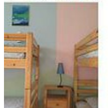
2 ' Les Bambis '