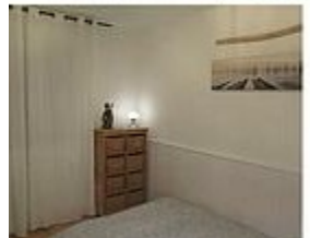
Parentale (lit 140 x 2m) ' Le Paradis ' SdB (douche à l'italienne et