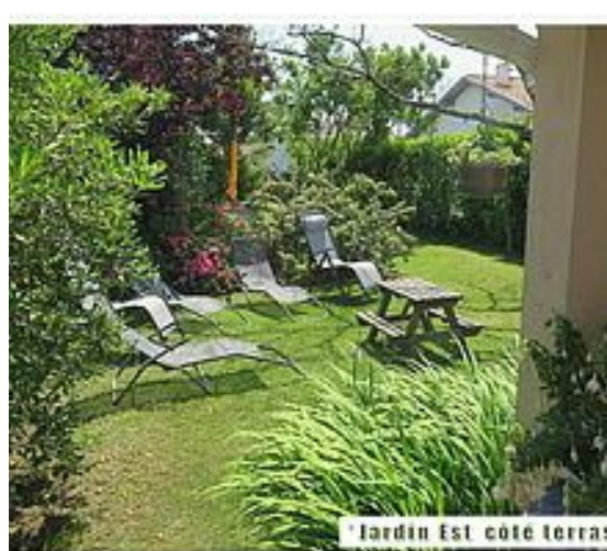
Jardin Est côté terrass