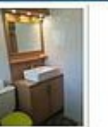
SdB (CH parentale)